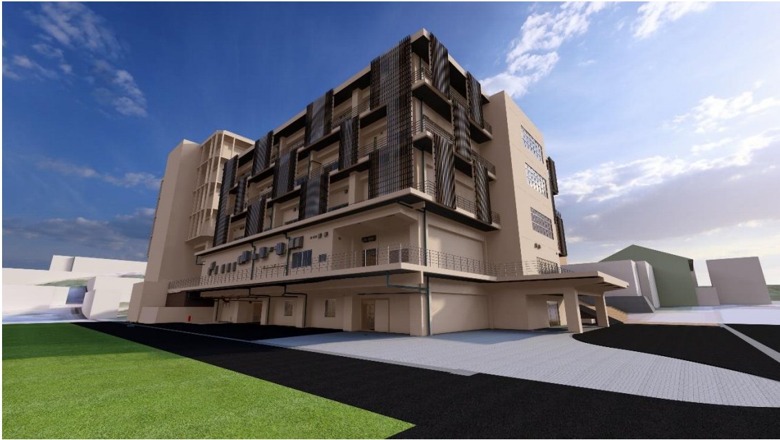
(看護学科棟側からの外観)