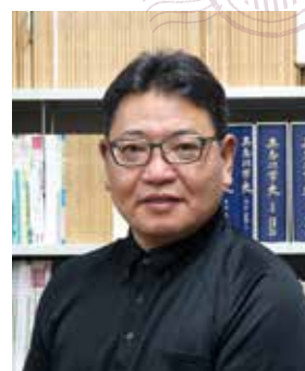
Dean of the Graduate School 国際文化研究科長(博士課程)